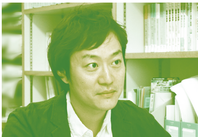
東北学院大学 教養学部 教授 専門=災害社会学

交通機関が未復旧だった2月初め、私は新幹線の高架橋が落ちたり家が倒壊している中を歩いて試験会場に向かいました。大学に入ると社会心理学の講義で災害が取り上げられましたが、その実例は直近の阪神淡路大震災ではなく、数十年前の新潟地震だったのです。学問では、しかるべき時間をかけなければ何かを言うことはできないという考えもあるでしょうが、私は疑問を持ちました。そこから研究者として、「災害とは何か」