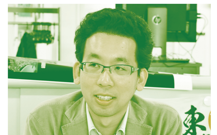
東北大学 災害科学国際研究所 准教授 専門=地震工学・災害情報学

(取材= 2015年11月6日/東北大学青葉山キャンパス 災害科学国際研究所棟3階 災害アーカイブ研究室にて)