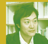
東北学院大学 教養学部 教授 (災害社会学)