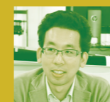
東北大学 災害科学国際研究所 准教授 (地震工学・災害情報学)